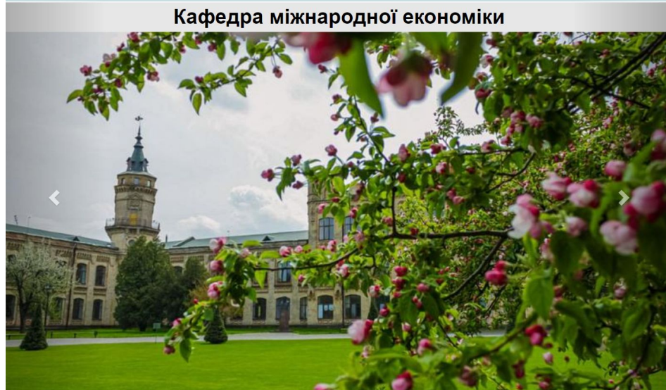
Кафедра міжнародної економіки