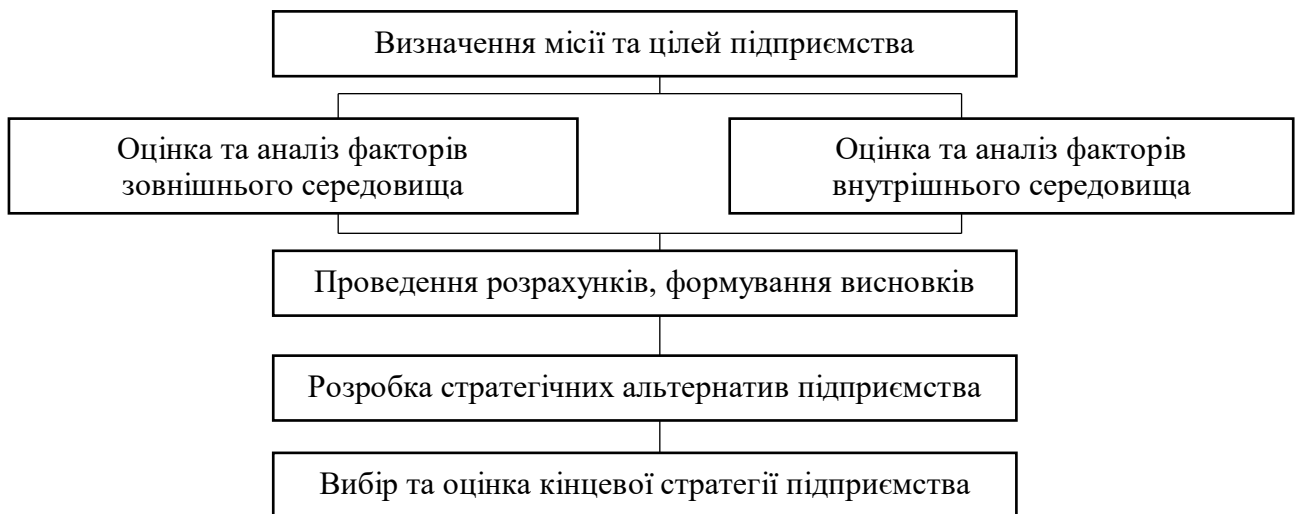
Рисунок 1.10 – Етапи стратегічного планування