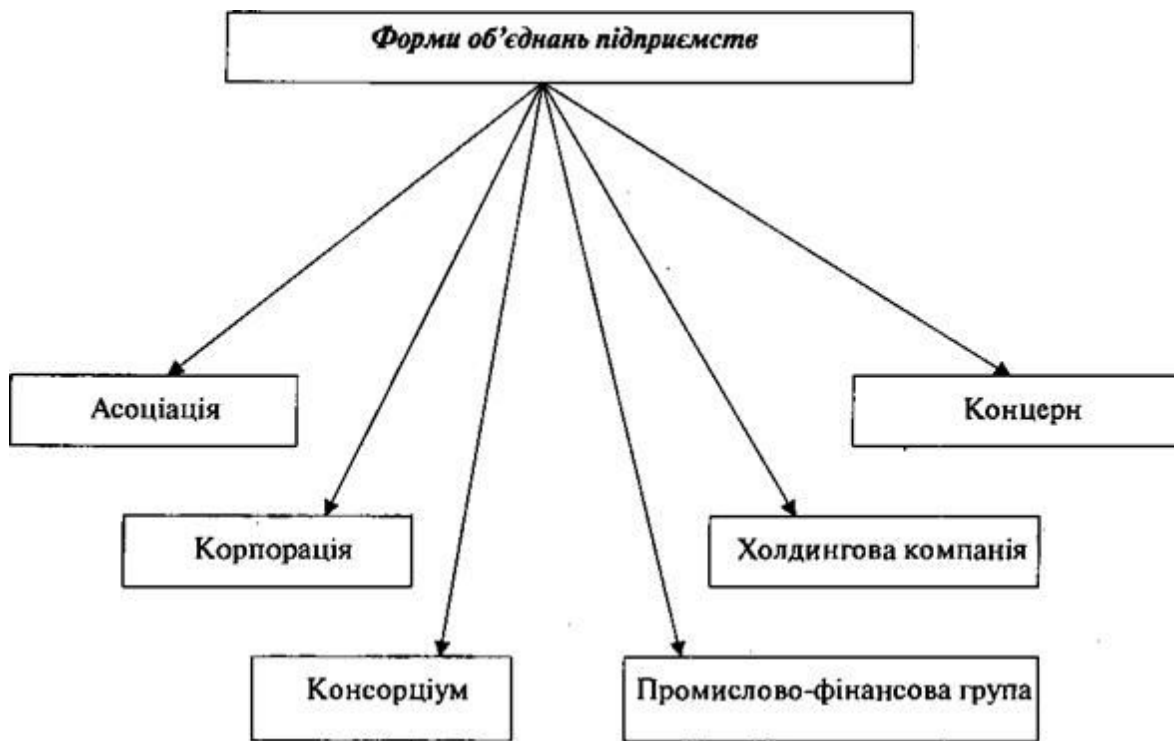
Рис. 1. Форми об'єднань підприємств

До статутних відносять: асоціації та корпорації, а представником договірних є консорціуми та концерни. Повний перелік форм об'єднання компаній проілюстрований на рис. 1.